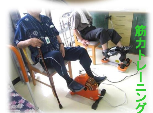
筋力トレーニング