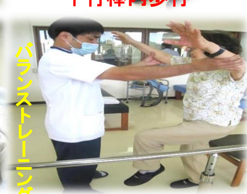
バランストレーニング