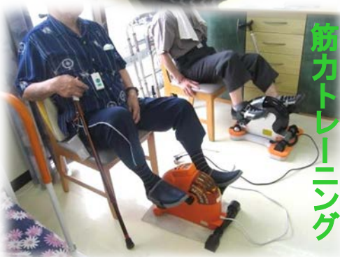
筋力トレーニング