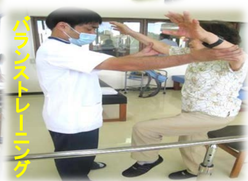
バランストレーニング